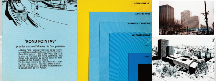
Montreuil - Rond Point 93