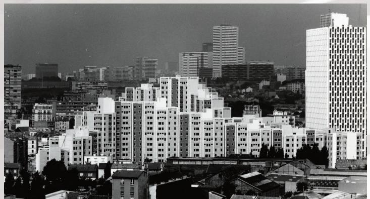
Montreuil - La cité de l'espoir